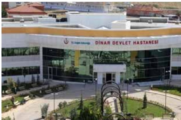
Динарская государственная больница