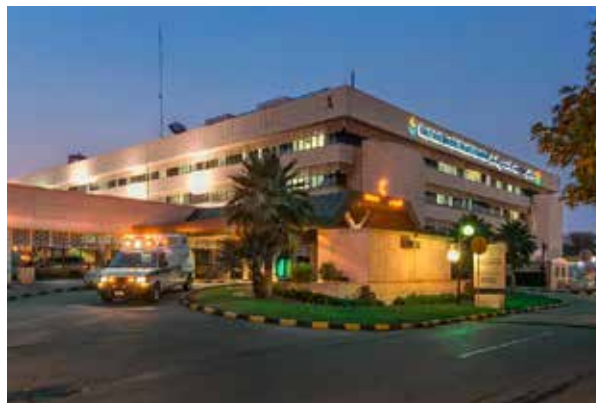
Саудовская Аравия - Больница Дамман