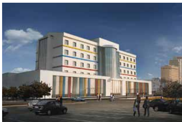
Больница Анталии Медикум