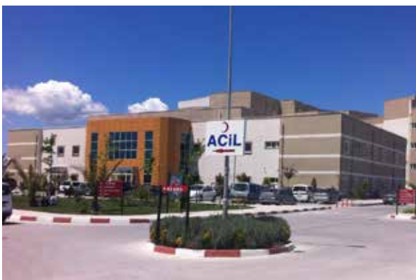
Урла государственная больница