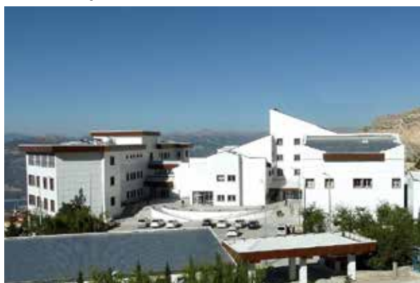
Эрменекская государственная больница