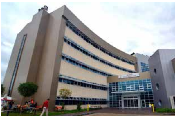
Деврекская государственная больница