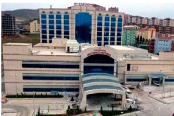
Сиртская государственная больница