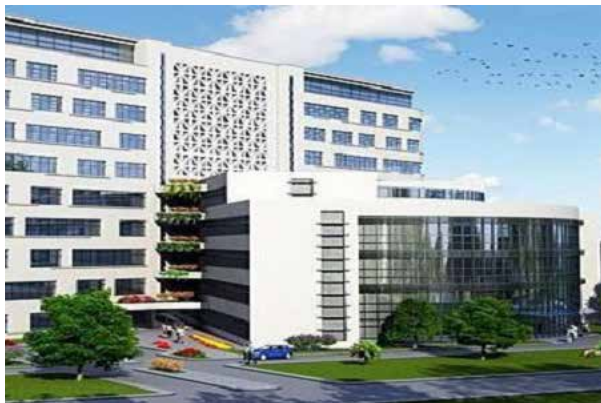
Государственная больница Коджаэли Гебзе