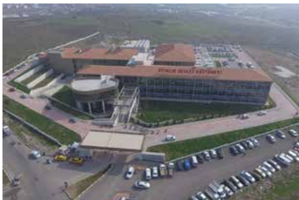
Айвалыкская государственная больница