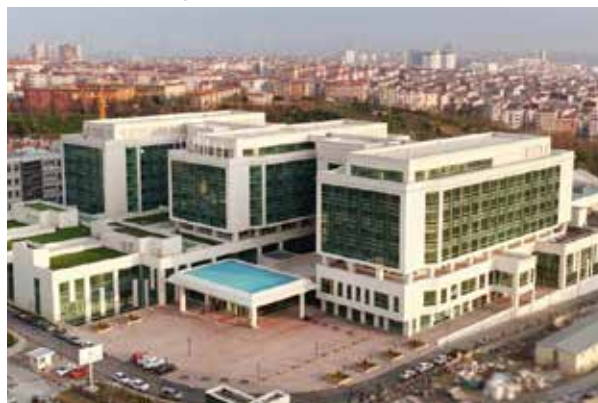
Стамбульская государственная больница Султангази