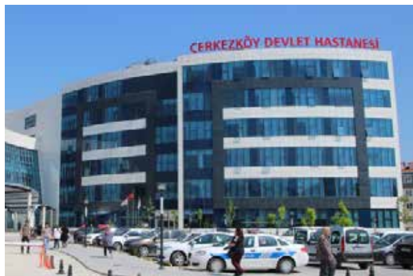
Черкезкёйская государственная больница