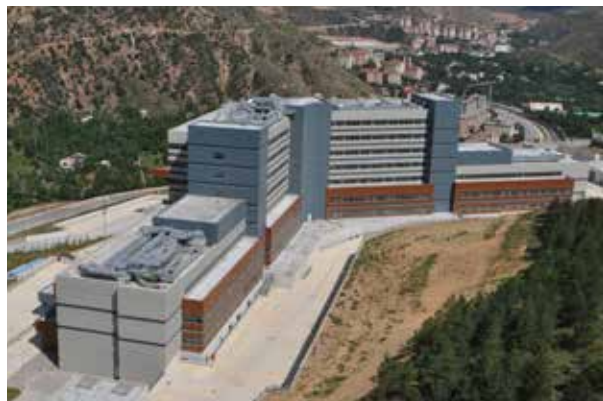
Государственная больница Гюмюшхане