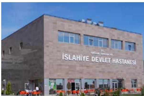
Государственная больница Ислахие