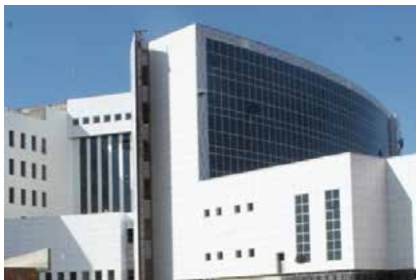
Аксарайская государственная больница