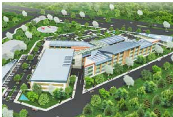
Бигская государственная больница