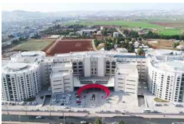
Шанлыурфа Еууёйюе Государственная больница