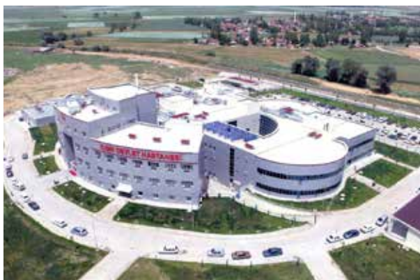
Ильгинская государственная больница