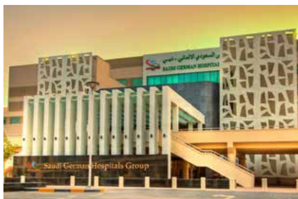
Саудовская Аравия - Больница Тадавул