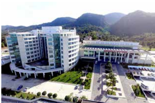
Орду Юные Государственная больница