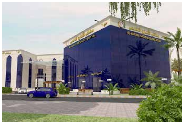
Саудовская Аравия - Специализированная больница Аль Ансари