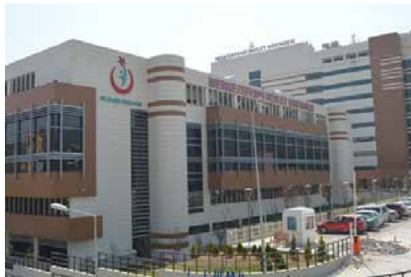
Маниса Меркезефенди государственная больница