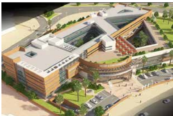
ОАЭ Дубай - Нейро Спинальная Больница