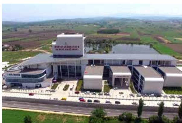
Бурса Государственная больница