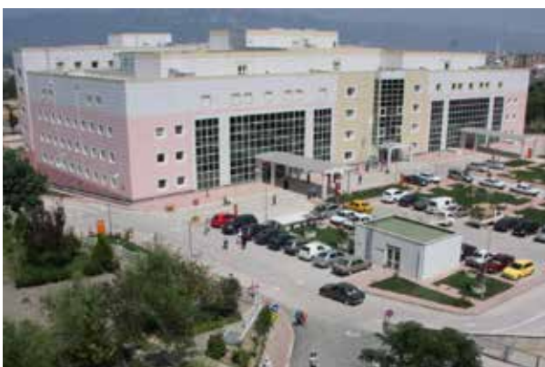
Кешанская государственная больница