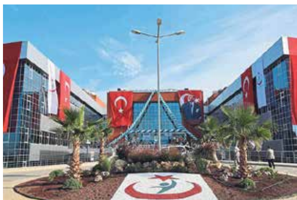
Государственная больница Измира Шигли