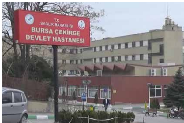
Государственная больница им. Бурсы Чекирге