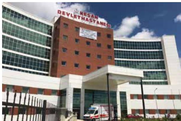
Кешанская государственная больница