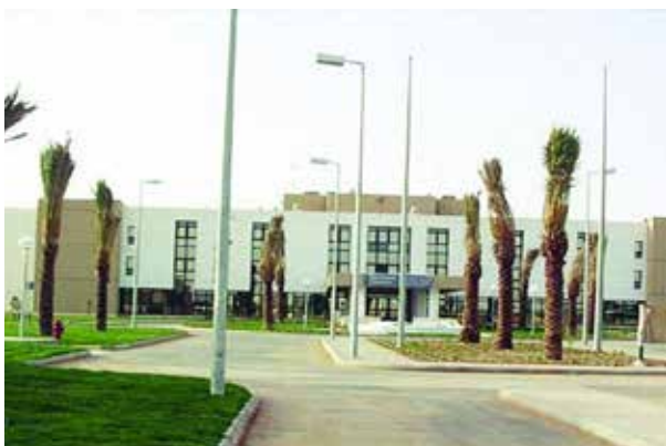
Саудовская Аравия - больница Рафха