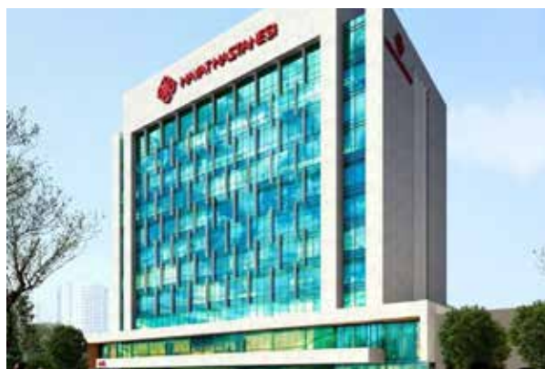
Больница Бурса Хаят