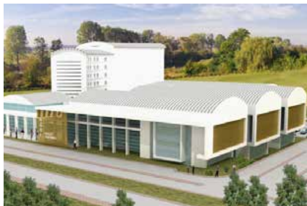
Государственная больница им. Агри Сучатаги