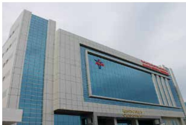
Саудовская Аравия - AGH Dammat