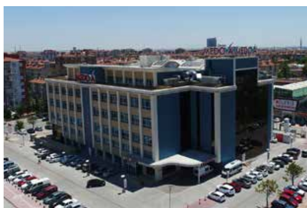
Больница Конья Медова