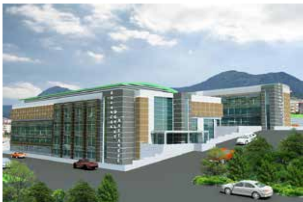
Буланджакская государственная больница