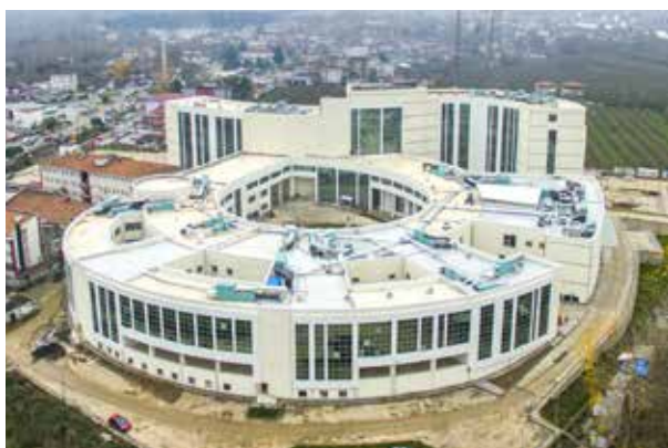
Самсунская государственная больница