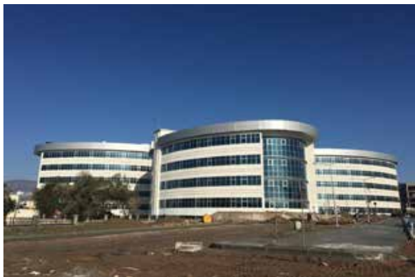
Борновская государственная больница