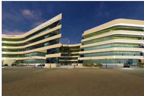
Саудовская Аравия - Больница Альмана Аль