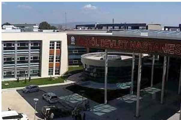
Государственная больница им. Бурсы Инегёля