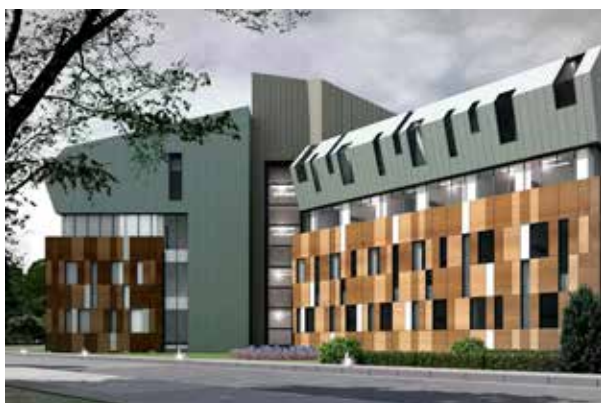
Ван Государственная больница