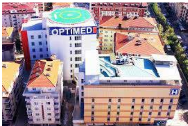
Больница Текирдаг Оптимед