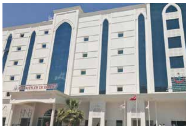
Больница Газиантеп Эрсин Арслан