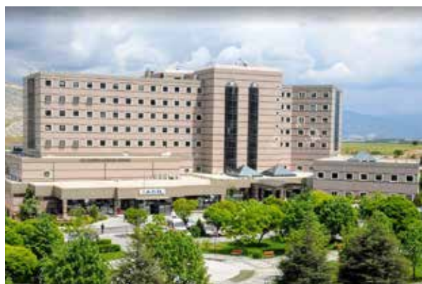
Университетская больница Испарта Сулеймана Демиреля