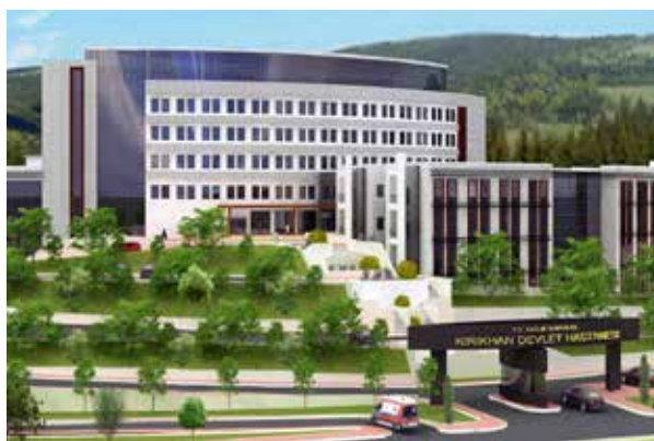
Хатайская государственная больница