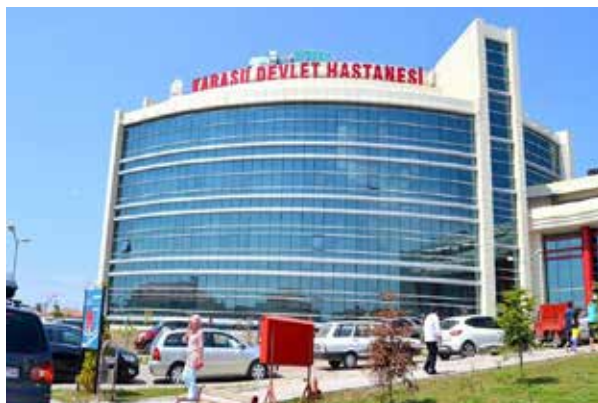
Карасуйская государственная больница