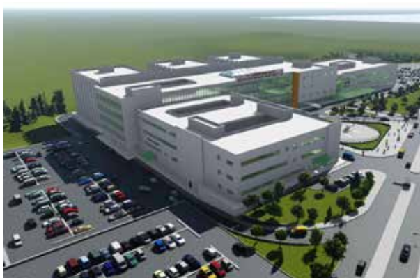
Яловская государственная больница