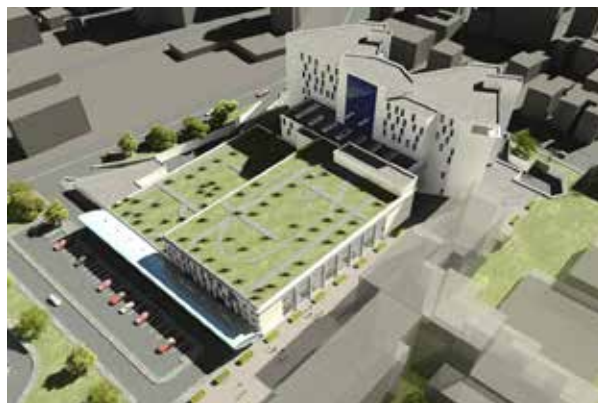
Адана Чукурова Государственная больница