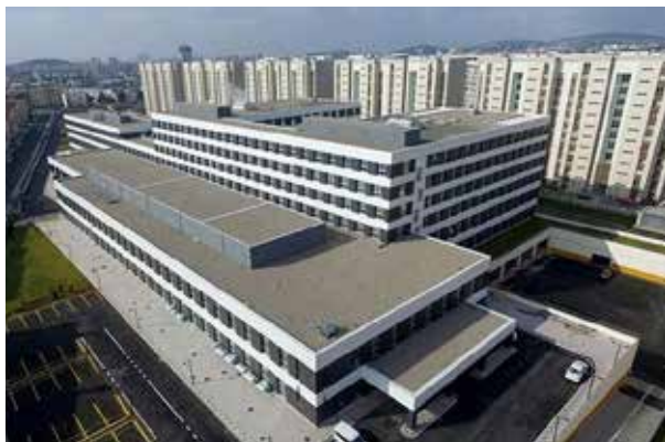
Стамбульская государственная больница Санкактепе