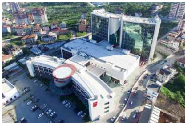
Больница Орду Фаца