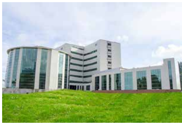
Симавская государственная больница