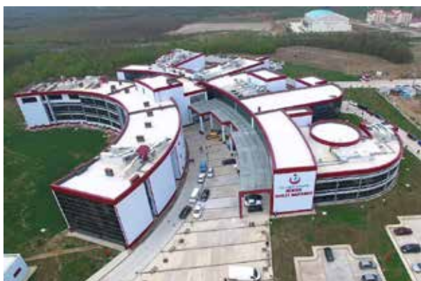
Государственная больница Хендек