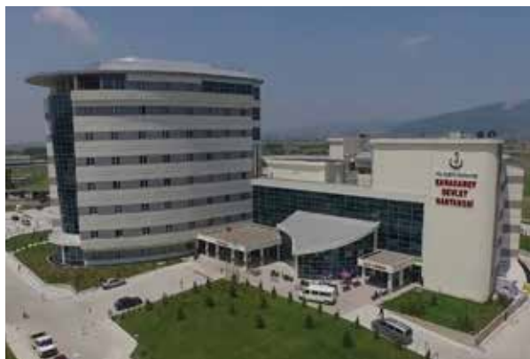
Каракабейская государственная больница