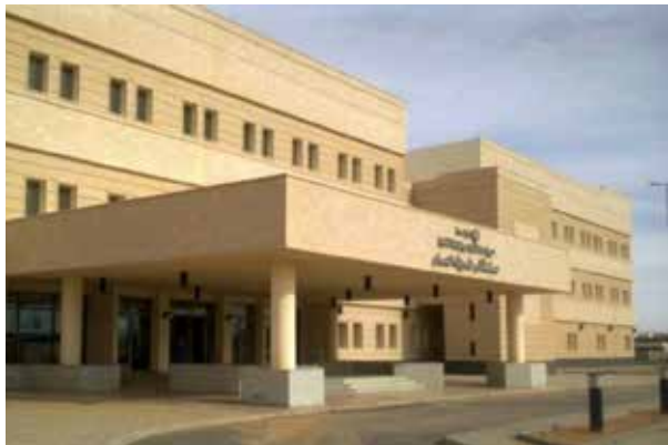
Саудовская Аравия больница общего профиля Азизия