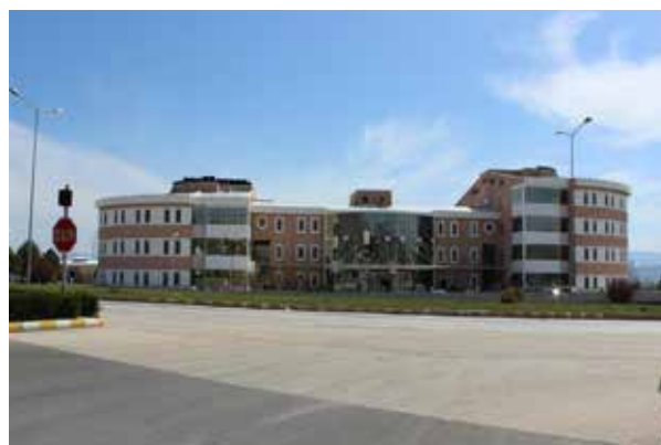
Зильская государственная больница