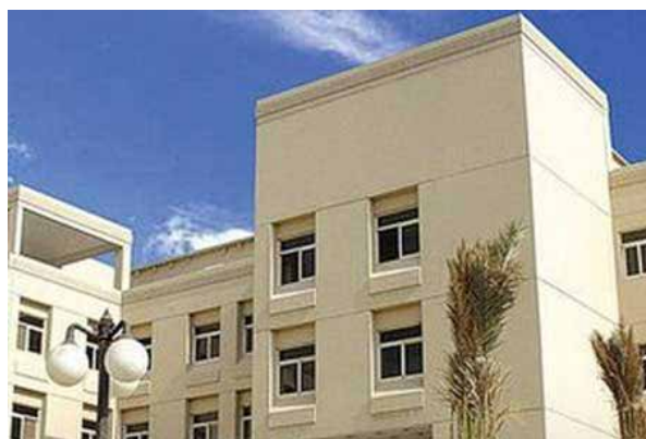
Пакистан - Больница Патель